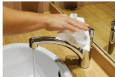
6. Fermer le robinet avec une serviette ou le bout de sa manche