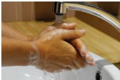
4. Rincer ses mains