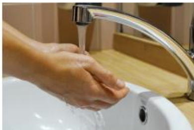
1. Mouiller ses mains