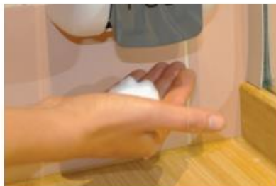
2. Utiliser du savon liquide