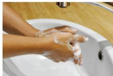
3. Compter jusqu'à 15 tout en savonnant et en frottant ses mains