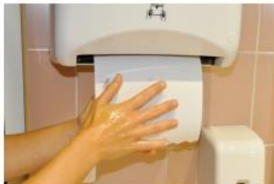
5. Sécher ses mains avec une serviette ou un sècheur automatique